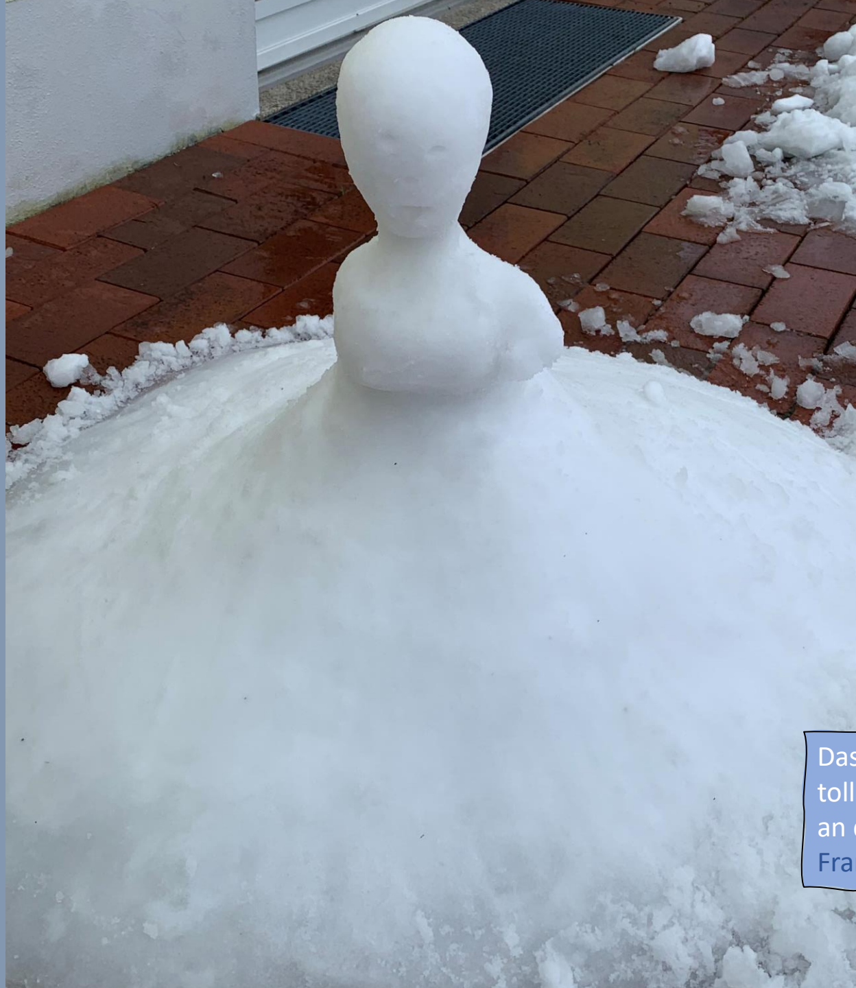
Dass auch schmelzender Schnee eine tolle Wirkung haben kann, sieht man an der zauberhaften Figur von Franziska Baumgärtner.